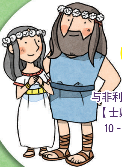
与非利士女人结婚 【士师记 14 章 10 - 11 节】