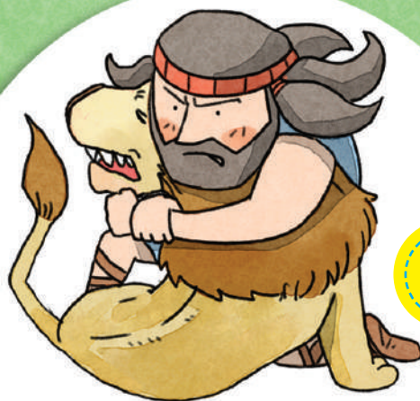
抓狮子得蜂蜜 【士师记 14 章 5 - 9 节】