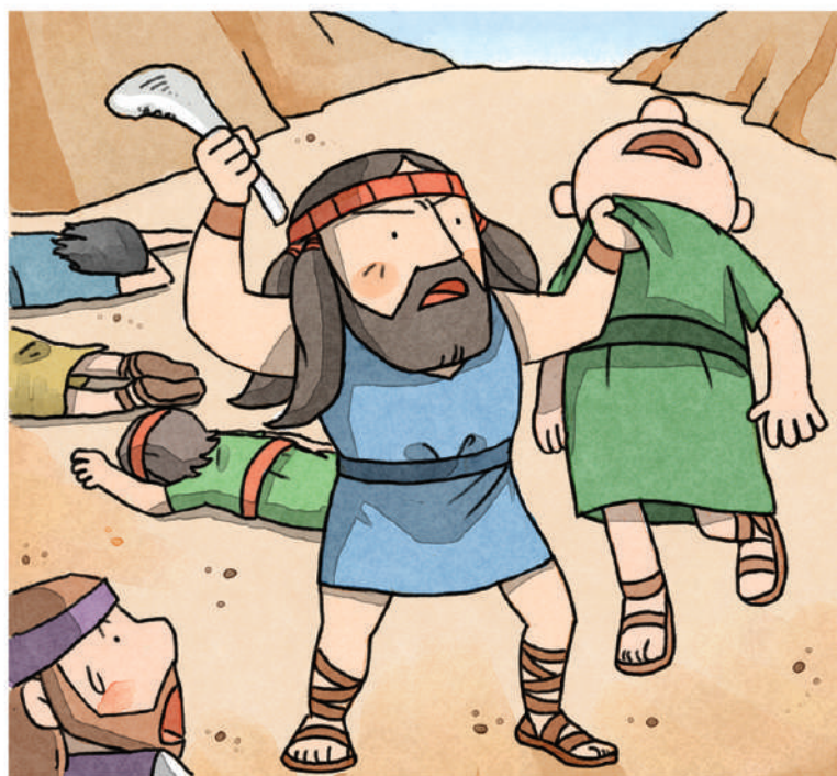
用驴腮骨杀了 1,000 个非利士人 【士师记 15 章 14 - 17 节】