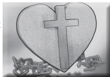
（图片六，十字架与断开锁炼的心）

让我们来看看金句的前半段，“耶和华—我的磐石，我的救赎主啊，愿我口中的言语、心里的意念在你面前蒙悦纳。”