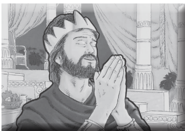
（图片一，祷告的大卫王）

神希望你说什么样的话呢？神为什么希望你能说出鼓励人的话语呢？（引导小朋友说出“神是爱，很亲切，很温柔，很良善”等答案）神希望你能像祂。