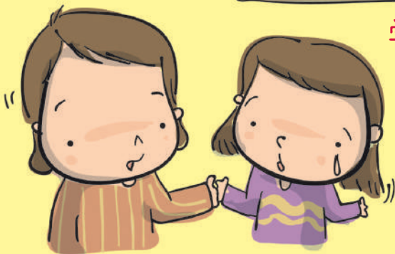
协谈人员，安慰的人