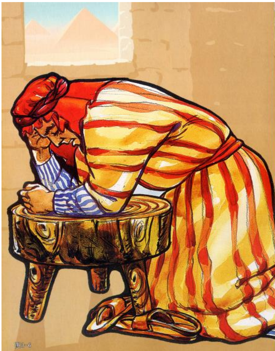
《喜乐树全人成长》第5辑第10讲：摩西（上）摩西传递神的信息