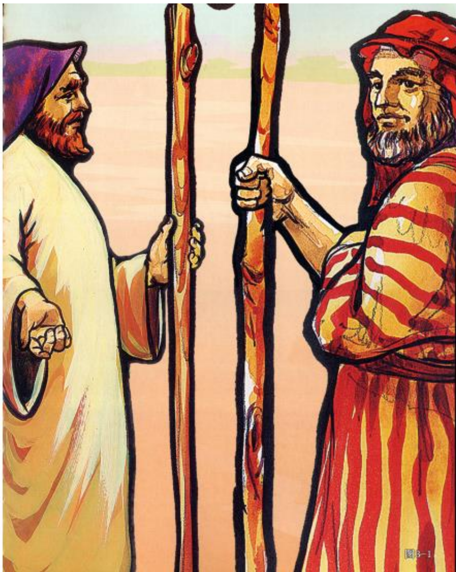
《喜乐树全人成长》第5辑第10讲：摩西（上）摩西传递神的信息