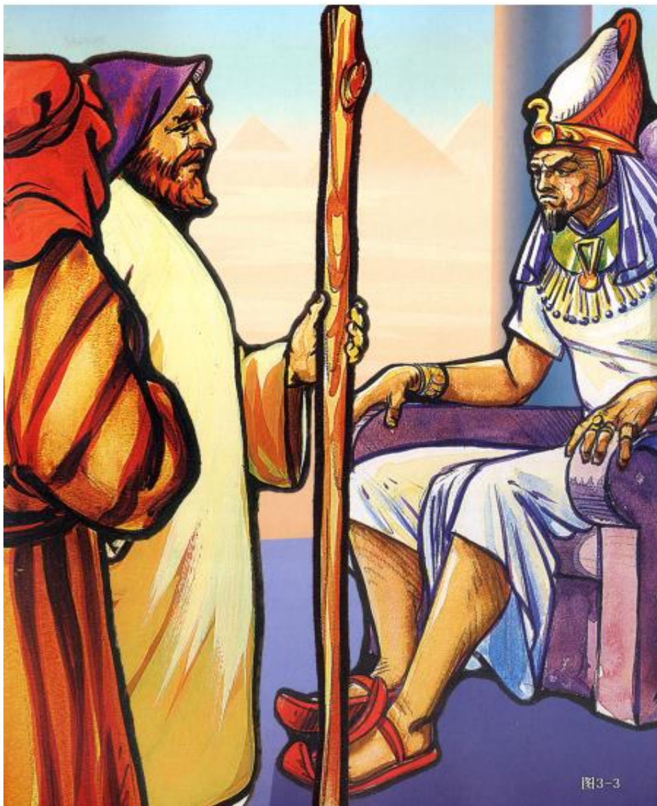
《喜乐树全人成长》第5辑第10讲：摩西（上）摩西传递神的信息