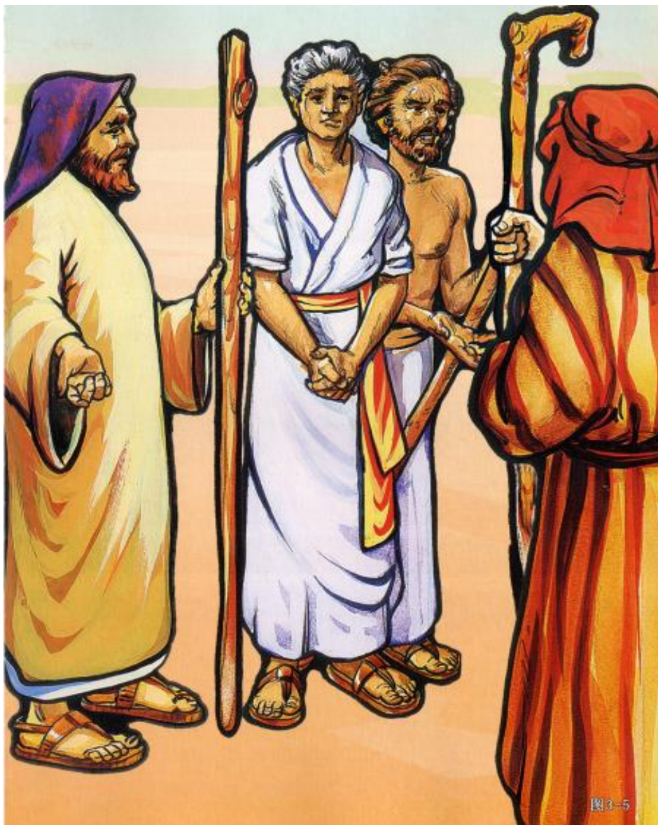
《喜乐树全人成长》第5辑第10讲：摩西（上）摩西传递神的信息