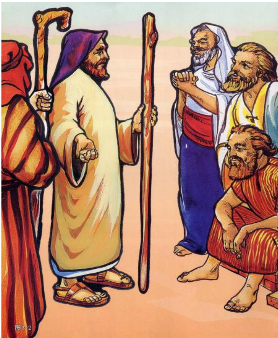
《喜乐树全人成长》第5辑第10讲：摩西（上）摩西传递神的信息